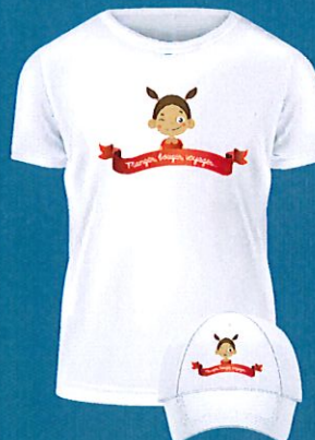
Des tee-shirt et des casquettes très sport pour le personnel du restaurant !