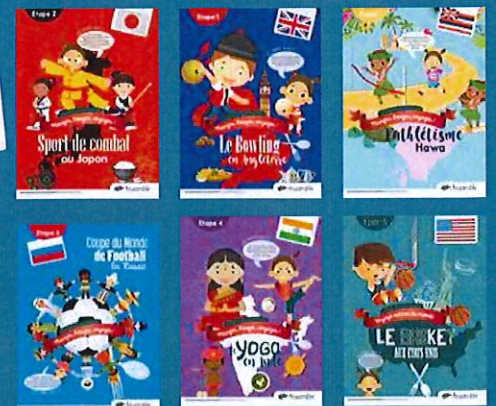
6 affiches décoratives avec des anecdotes sur les sports emblématiques des pays